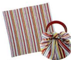
むす美 モダンガールいちごバッグ しましまマルチ

◎アントステラインテリアショップ ☎050-5806-3213 http://auntstella-interior.jp