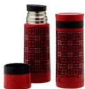
aladdin ステンレスボトル/タンブラー

どこか懐かしさを感じるレトロなチェック柄が目引くボ トルは、二重構造のステンレス製。保温・保冷性がバツ グンで、オールシーズン重宝します。¥3,465