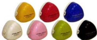
サブヒロモリ ホルダーおにぎりランチ

◎マムズリトルシングス ☎03-5425-2715 http://www.rakuten.ne.jp/gold/littlethings/