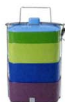
rice メラミンランチボックス

◎山田織維 ☎03-5414-6789 http://www.ymds.co.jp