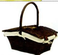
AUNT STELLA'S スクエアピクニックバスケット

皮を残したワイロー(＝柳)を編み込んだ、風合い豊か なバスケット。レースアレンジがピクニックに華を添えま す。取りはずし可能なライナー付き。¥4,725