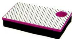
room it up ラップデスク

◎マムズリトルシングス ☎03-5425-2715 http://www.rakuten.ne.jp/gold/littlethings/